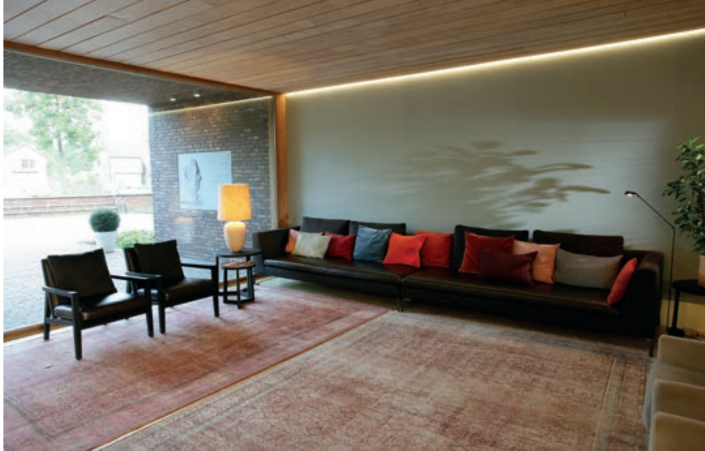
De kleurrijke kussens en de gestoffeerde wand met hoge aaibaarheidsfactor, gerealiseerd door Bojoli by Josephine de Wild, dragen bij tot de knusse sfeer in de lobby. Let bovenaan op de aflijning van de wand met indirect licht.